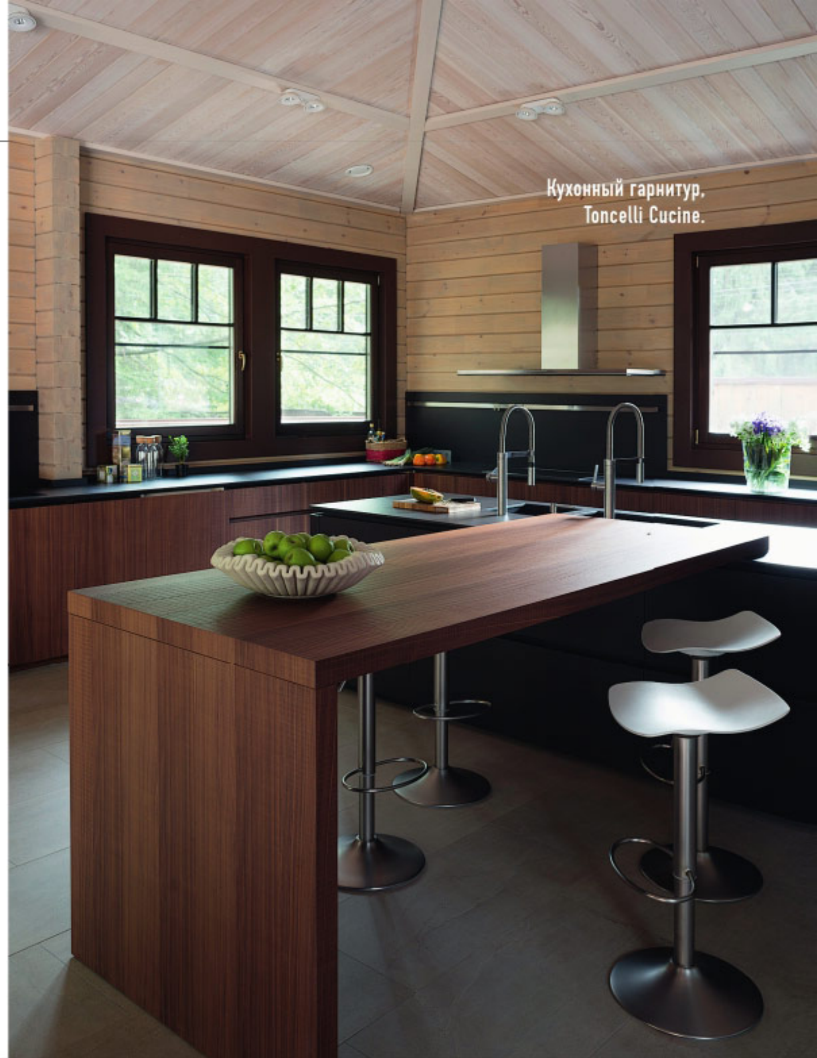
Кухонный гарнитур, Toncelli Cucine.

Дом напоминает букву “П”, поэтому образует единенную зону патио, выходящую к лесу, – там можно, например, готовить барбекю. Но вообще большие окна в доме раздвигаются, и в теплое время года зоны бассейна и улицы плавно перетекают одна в другую. ■