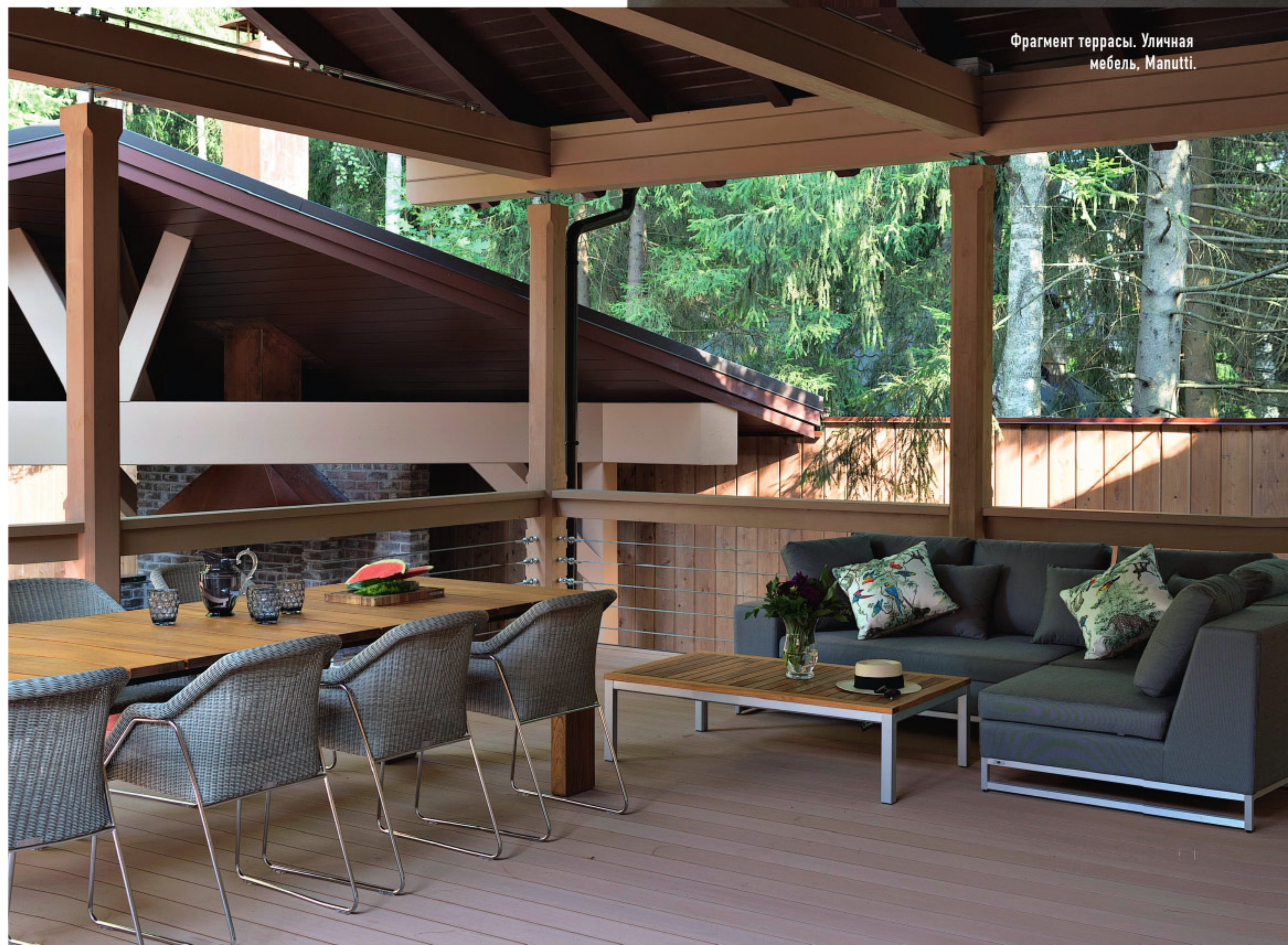
Фрагмент террасы. Уличная мебель, Manutti.