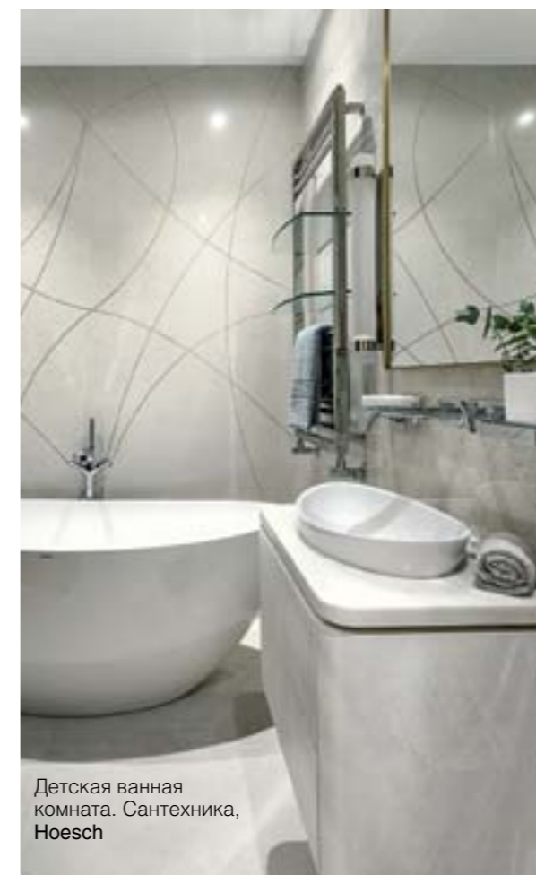
Детская ванная комната. Сантехника, Hoesch